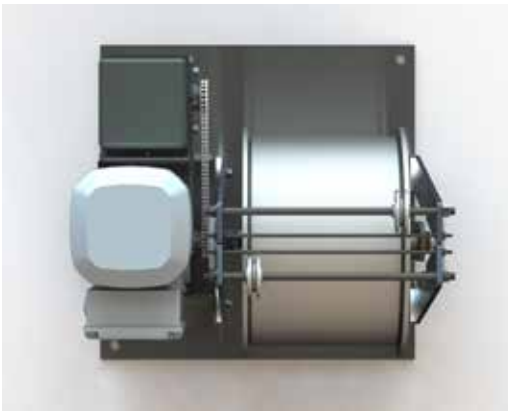
VUE DU DESSUS